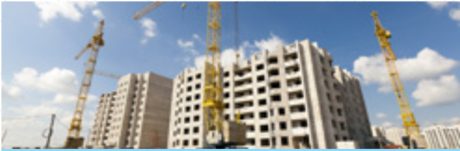
BÂTIMENTS ET TRAVAUX PUBLICS