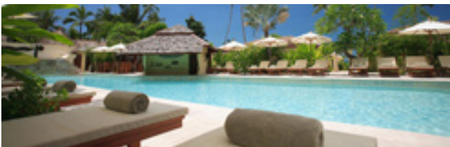
HÔTELLERIE ET RESTAURATION