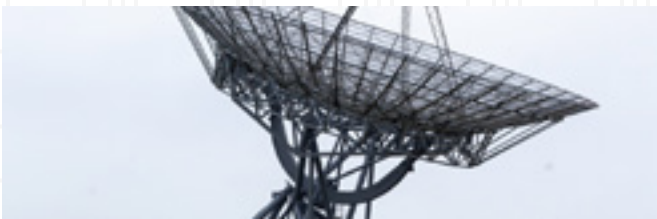
TELECOMMUNICATION ET NTIC