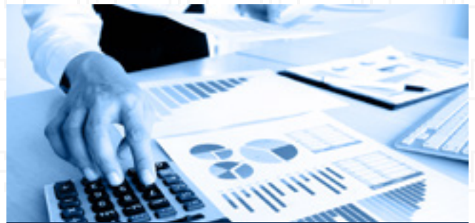
FINANCE & COMPTABILITE