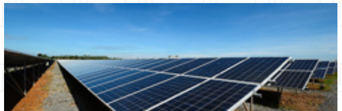
ENERGIE ET RESSOURCES NATURELLES